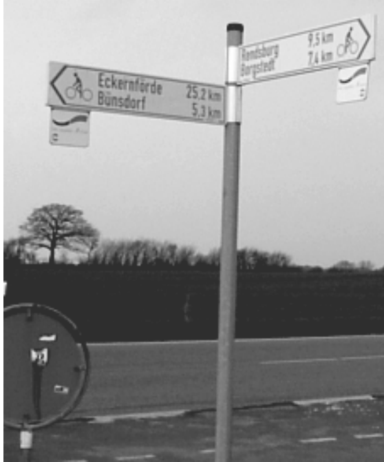
Rendsburg-Gettorf, Blick nach Nordosten

mehr weit“ – „Ich hab Durst“ – „Und ich hab