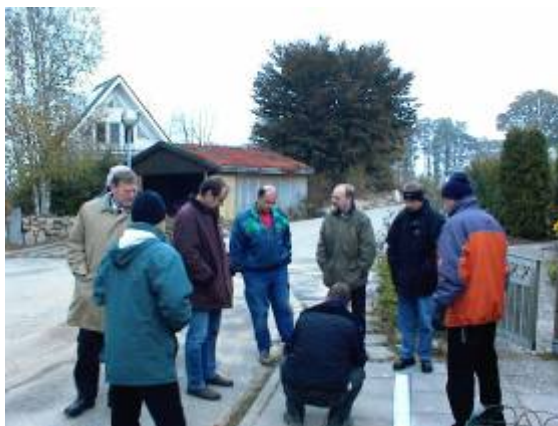
Abnahme am Aukamp

Die Mehrzahl der noch nicht bebauten Grundstücke sollen in diesem Jahr bebaut werden. Drei Grundstücke will die Gemeinde als Baulandreserve zurückhalten und nach Bedarf in den nächsten Jahren verkaufen.