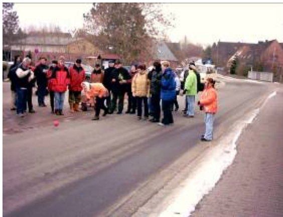
Start vom Feuerwehrgerätehaus zum Feldweg

Die Spieler einer Mannschaft lassen die 1200 g schweren Kugeln mit gewaltigem Schwung so weit wie möglich voraus über die Strecke rollen. Wo jeweils die Kugel zum Stillstand kommt, bringt der nächste Spieler sie wieder mit weit ausholendem Schwung zum Rollen. (Für Kinder gibt es eine nach Alter gestaffelte Bonusregelung.) Es leuchtet ein, dass die Mannschaft mit der geringsten Zahl der Würfe (=Spielereinsätze) gewinnt.